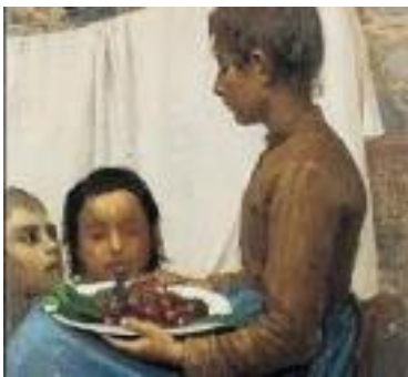
Pellizza da Volpedo- Le ciliegie

Si inizierà con una breve visita alla ricerca dei fiori e della frutta o degli animali (a seconda del percorso prescelto). Proveremo a riconoscerli e attraverso una sorta di collage e puzzle con materiali diversi ricostruiremo uno dei dipinti.