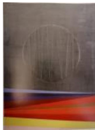
Roberto Crippa - Eclisse