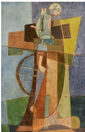
Afro - Ordigni

Durante il laboratorio proveremo a rifare un dipinto astratto utilizzando diversi materiali