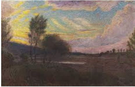
Pellizza da Volpedo – Nubi di sera sul Curone

Durante il laboratorio coloreremo con le tempere un dipinto a scelta tra quelli proposti cercando di riprodurre lo stile divisionista.