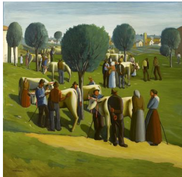
Pietro Morando - Il mercato del bestiame