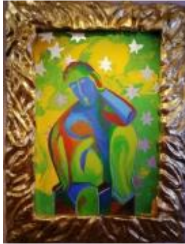
SANDRO CHIA - FIGURA