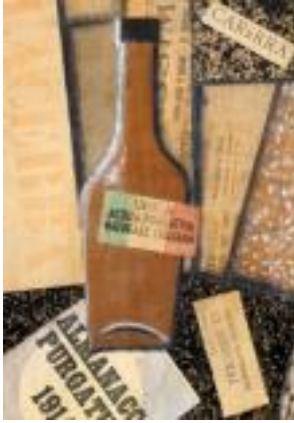
Carlo Carrà – Lacerba e Bottiglia