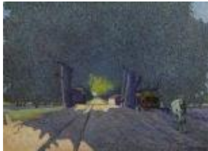
Pietro Morando – Ponte sul Bormida